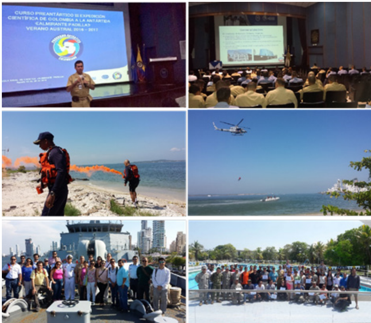
Figura 13. Registro fotográfico de algunas de las actividades teóricas y prácticas del Curso Preantártico 2016.