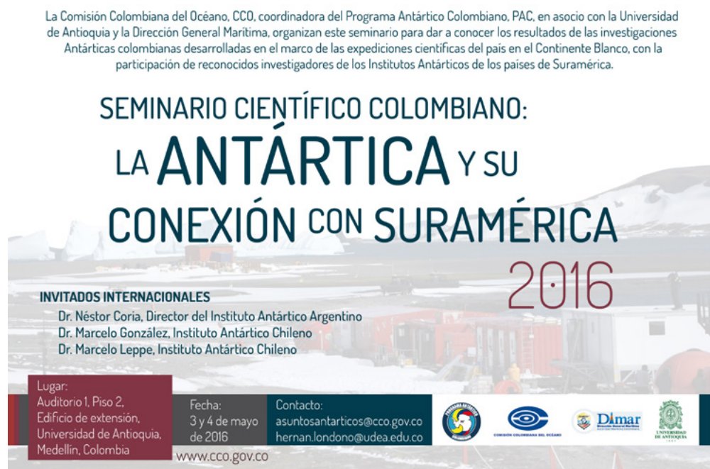
Figura 2. Presentación del Seminario Científico Colombiano: la Antártica y su conexión con Suramérica 2016.

Así mismo, el 17 de mayo la Comisión Colombiana del Océano, coordinadora del PAC, la Armada Nacional y la Universidad Militar Nueva Granada realizaron el evento “Antártica: Ambiente Marino Estratégico” (Figura 3), donde se realizó un reconocimiento a los investigadores y expedicionarios partícipes de la II Expedición Científica de Colombia a la Antártida “Almirante Lemaitre”, Verano Austral 2015-2016, y el lanzamiento de la III Expedición Científica de Colombia a la Antártida “Almirante Padilla”, Verano Austral 2016-2017. El evento fue inaugurado por el señor Almirante Leonardo Santamaría Gaitán, Comandante de la Armada Nacional, y contó con la participación de cerca de 600 personas entre distinguidos invitados de las Fuerzas Militares, la academia e instituciones con interés en el tema, con el fin de crear apropiación de país por parte del PAC.