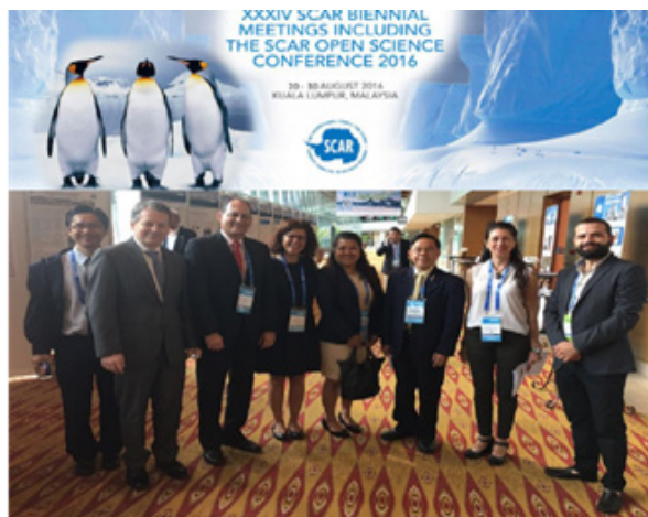
Figura 11. Registro fotográfico de la participación de la CCO como delegada de país a la XXXIV Conferencia del Comité Científico de Investigaciones Antárticas (SCAR).

Por otra parte y con el fin de dar continuidad a las actividades de divulgación del PAC y de aquellas realizadas en el marco de las expediciones científicas de Colombia a la Antártida, la Comisión Colombiana del Océano participó y representó a Colombia en la XXXIV Conferencia de Ciencias del Comité Científico de Investigaciones Antárticas (Figura 11), realizada del 20 al 30 de agosto de 2016 en Kuala Lumpur, Malasia, donde aunado a gestiones previas de la CCO, el país se vinculó como miembro asociado del SCAR.