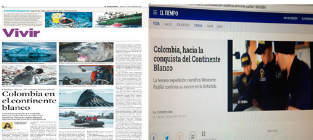
Figura 14. Algunos ejemplos de notas de la Expedición "Almirante Padilla" difundidas por los medios de comunicación.