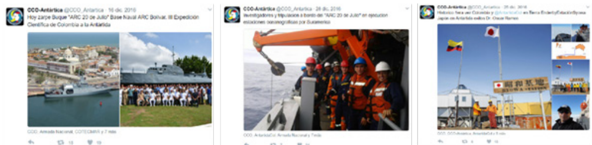
Figura 16. Algunas de las actividades divulgativas de la III Expedición Científica de Colombia a la Antártida “Almirante Padilla”, Verano Austral 2016-2017, a través del twitter @CCO_Antartica, de la Comisión Colombiana del Océano.