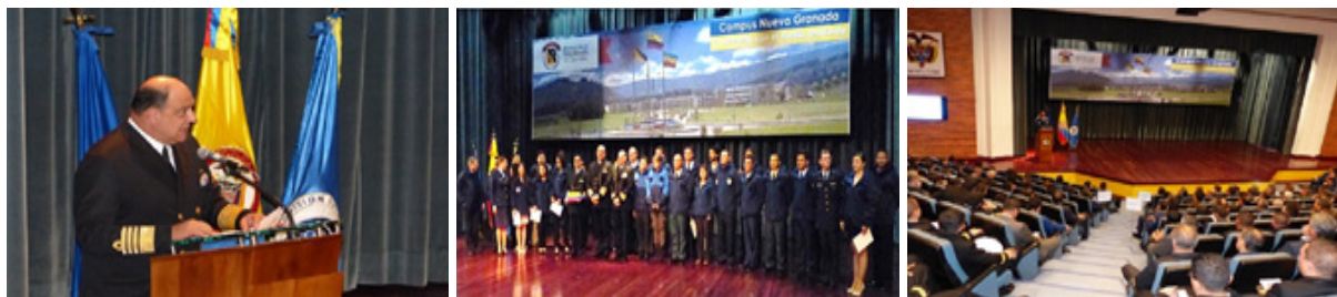
Figura 3. Registro fotográfico del evento Antártida: Ambiente Marino Estratégico.

Seguidamente, del 1 al 6 de agosto de 2016 se realizaron dos eventos: el II Seminario Colombiano en la Antártida: un desafío logístico y operacional, y el Curso Preantártico 2016 (Figura 4). El objetivo principal del seminario fue brindar las herramientas necesarias a los expedicionarios nacionales en temas logísticos y operacionales en la Antártida, para aumentar los conocimientos en esta materia y facilitar la planeación, desarrollo y ejecución de la III Expedición Científica de Colombia a la Antártida “Almirante Padilla”, Verano Austral 2016-2017, futuras expediciones y el establecimiento de la Estación Científica de Colombia en la Antártida, con lo cual puedan enfrentar adecuadamente una eventual emergencia marítima, entre otros temas.