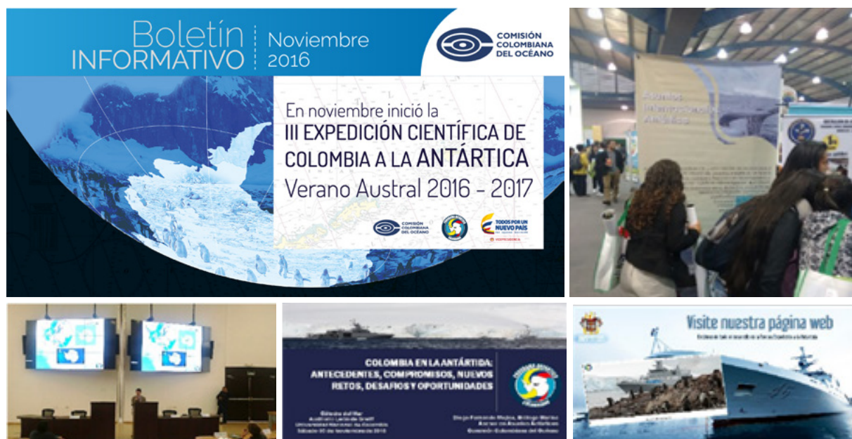
Figura 6. Registro de actividades desarrolladas durante 2016 para divulgar el Programa Antártico Colombiano y la III Expedición Científica de Colombia a la Antártida "Almirante Padilla", Verano Austral 2016-2017, en diferentes medios y canales de comunicación.

Teniendo en cuenta las acciones que el país viene realizando para desarrollar todo su potencial como Estado marítimo, de manera sostenible y promoviendo la generación de identidad nacional con el mar, la CCO con el acompañamiento del CTN AA, conformado por instituciones estatales, académicas y no gubernamentales, trabaja para lograr que Colombia pase de ser miembro adherente a miembro consultivo del Sistema del Tratado Antártico. Para esto es necesario, además de mostrar aportes en investigación sostenidos y de calidad, fortalecer el Programa Antártico Colombiano