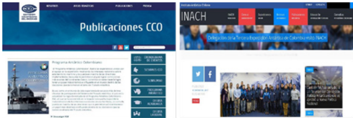
Figura 15. Algunos canales, medios y charlas divulgativas desarrolladas durante 2016 para socializar las actividades del Programa Antártico Colombiano y la III Expedición Científica de Colombia a la Antártida “Almirante Padilla”, Verano Austral 2016-2017.

En adición a lo anterior, durante el transcurso de la expedición las instituciones e investigadores que hicieron parte de ella divulgaron sus proyectos y actividades de investigación a través de las páginas web y redes sociales de estas instituciones y del PAC (Comunicaciones de la Armada), destacándose el twitter de @CCO_Antartica de la oficina de asuntos antárticos de la Comisión Colombiana del Océano, que ha venido acompañando y haciendo difusión de todas las actividades de la expedición del componente buque y el componente cooperación internacional, entre otros eventos y actividades del PAC (Figuras 15 y 16).