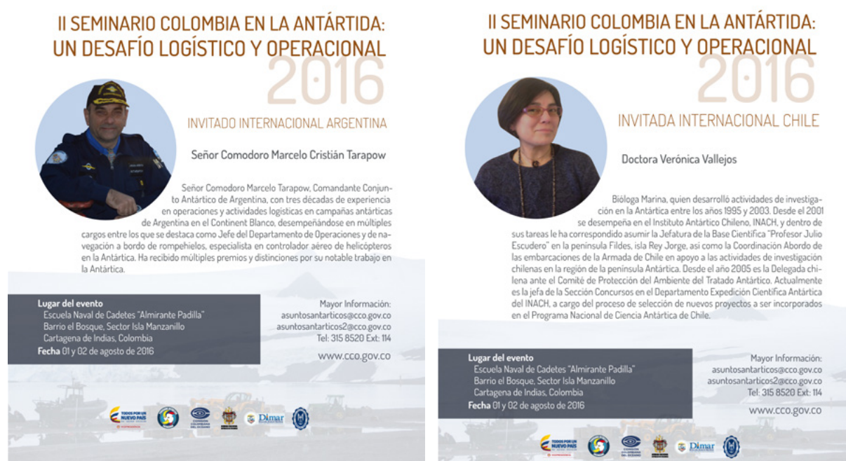
Figura 5. Piezas divulgativas sobre los invitados internacionales a los eventos Seminario Colombia en la Antártida: un desafío logístico y operacional y Curso Preantártico 2016.

Además de los eventos antes mencionados según la hoja de ruta 2016 del Programa Antártico Colombiano, se realizaron otras actividades para divulgar la III Expedición Científica de Colombia a la Antártida “Almirante Padilla”, Verano Austral 2016-2017, entre las que se destaca el boletín informativo de la CCO de noviembre de 2016, además de la labor del Departamento de Comunicaciones de la Armada Nacional de Colombia y la página web del Programa Antártico Colombiano por medio de la cual se informó sobre el itinerario de la tercera expedición.