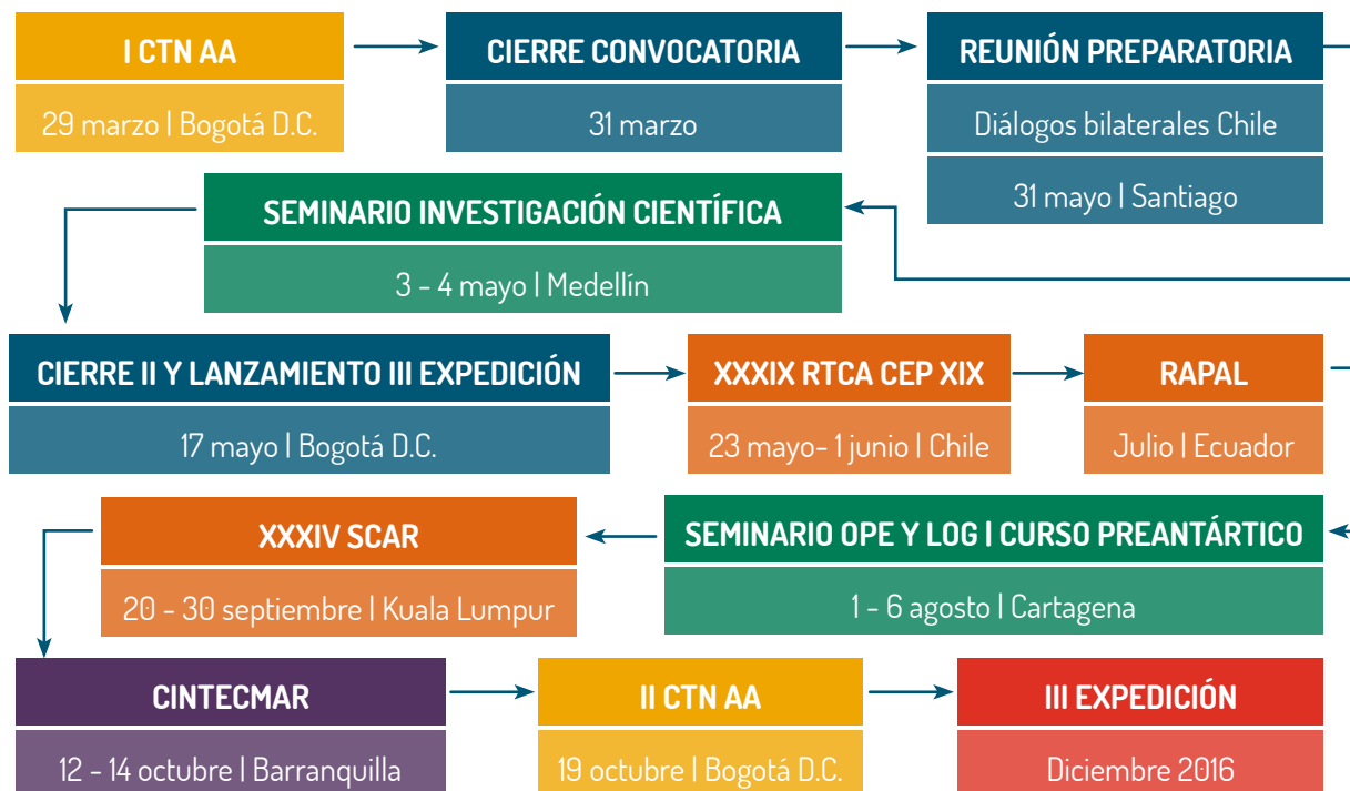
Figura 1. Hoja de ruta del Programa Antártico Colombiano (PAC) 2016.

Como parte de las actividades de divulgación previas a la III Expedición Científica de Colombia a la Antártida "Almirante Padilla", Verano Austral 2016-2017, la Comisión Colombiana del Océano, líder y coordinadora del Programa Antártico Colombiano, construyó y planificó la hoja de ruta del PAC 2016 (Figura 1), en el cual como estrategia de divulgación y apropiación del tema de asuntos antárticos en el país, marcó el sendero para la intervención de Colombia en los escenarios internacionales antárticos y en la estructuración de algunos eventos a nivel nacional, con la participación de las instituciones e investigadores que hacen parte del Comité Técnico Nacional de Asuntos Antárticos (CTN AA) y personas interesadas en el tema.